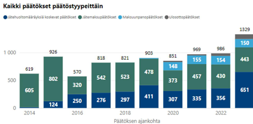
Kuva 2 Kiinteistöjä koskevat päätösasiat asiatyypeittäin

Jätehuoltopäällikön ratkaisemia poikkeamispäätöksiä koskeva määrällinen tavoite (900 annettua päätöstä) saavutettiin. Poikkeamispäätösten määrä kasvoi jälleen edellisvuodesta jopa 343 päätöksellä. Jättemaksuja ja jätehuoltomääräyksiä koskevia poikkeamispäätöksiä tehtiin toimintavuonna 1 329 kpl, mikä on eniten jätehuoltoviranomaisen toimintahistorian aikana. Hakemusten määrän kasvuun vaikutti erityisesti jätehuoltomääräysten poikkeamishakemusten lisääntyminen aiemmista vuosista. Näiden määrä lisääntyi noin 300 kappaleella, vaikka esimerkiksi jätehuoltomääräyksiä on lievennetty mm. sekajäteastian tyhjennysvälin pidentämisen osalta. Lisäksi päätösten voimassaoloaikoja on pidennetty.