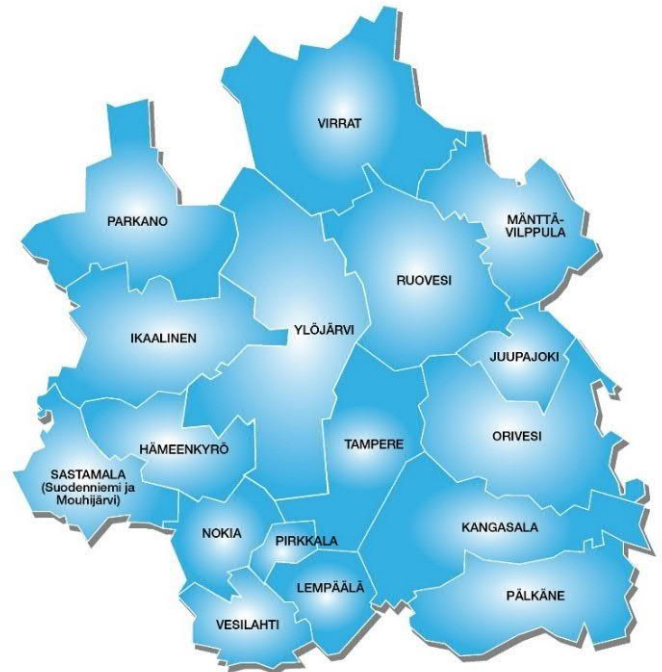
Kuva 1 Jätehuoltoviranomaisen toiminta-alue

Yhteistoiminta-alueeseen kuuluu 17 Pirkanmaan kuntaa: Hämeenkyrö, Ikaalinen, Juupajoki, Kangasala, Lempäälä, Mänttä-Vilppula, Nokia, Orivesi, Parkano, Pirkkala, Pälkäne, Ruovesi, Sastamala (entisten Mouhijärven ja Suodenniemen osalta), Tampere, Vesilahti, Virrat ja Ylöjärvi. Toimialueella on noin 470 000 asukasta ja noin 39 500 vapaa-ajan asuntoa. Tampereen kaupunki toimii jätehuollon yhteistoiminta-alueen isäntäkuntana.